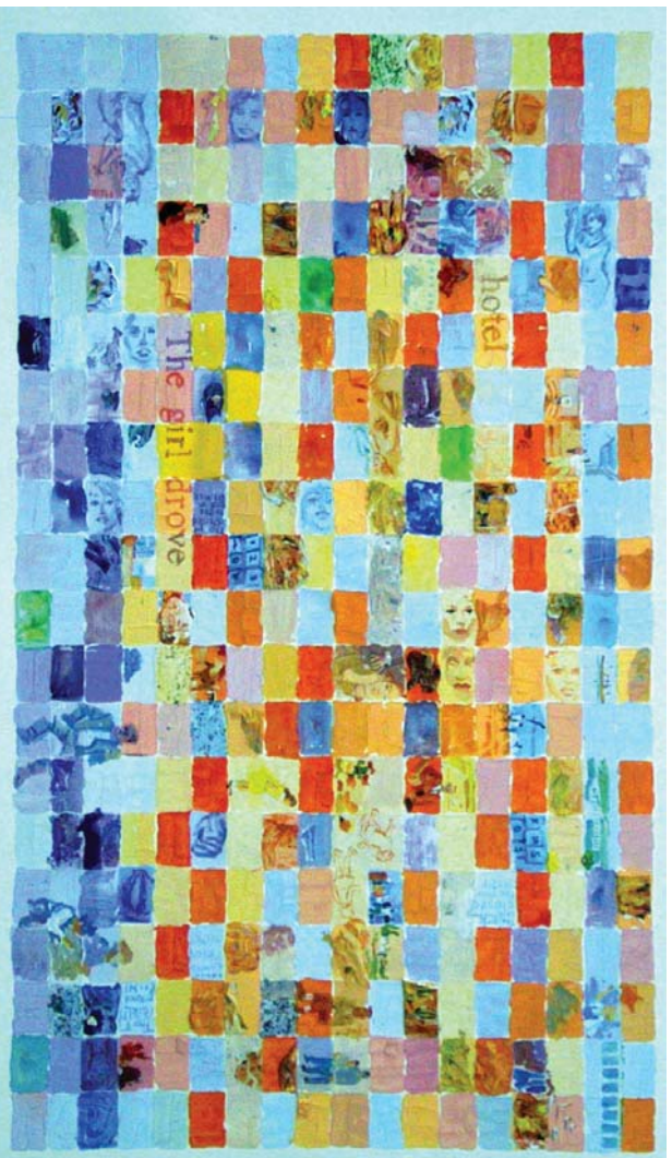
JACKIE DROVE ALL NIGHT - MANUEL DEL VALLE 2004