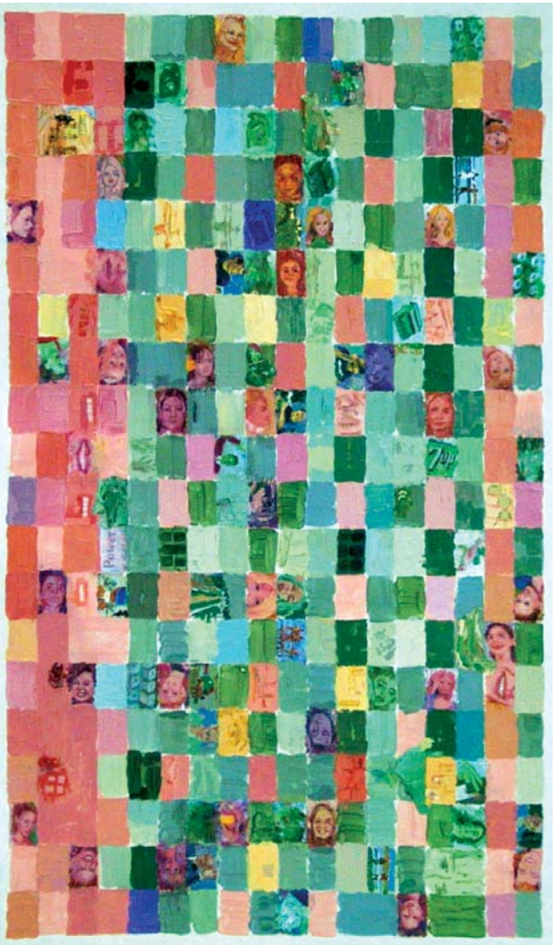
ROSE HIPS - MANUEL DEL VALLE 2004