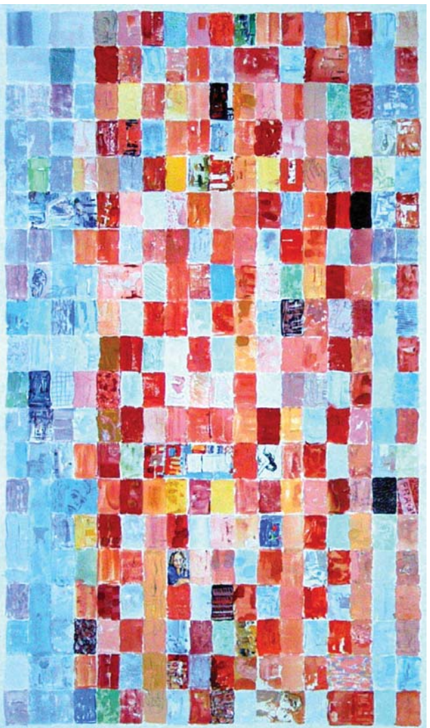
WANDA WENT BACK TO YOUTH - MANUEL DEL VALLE 2004