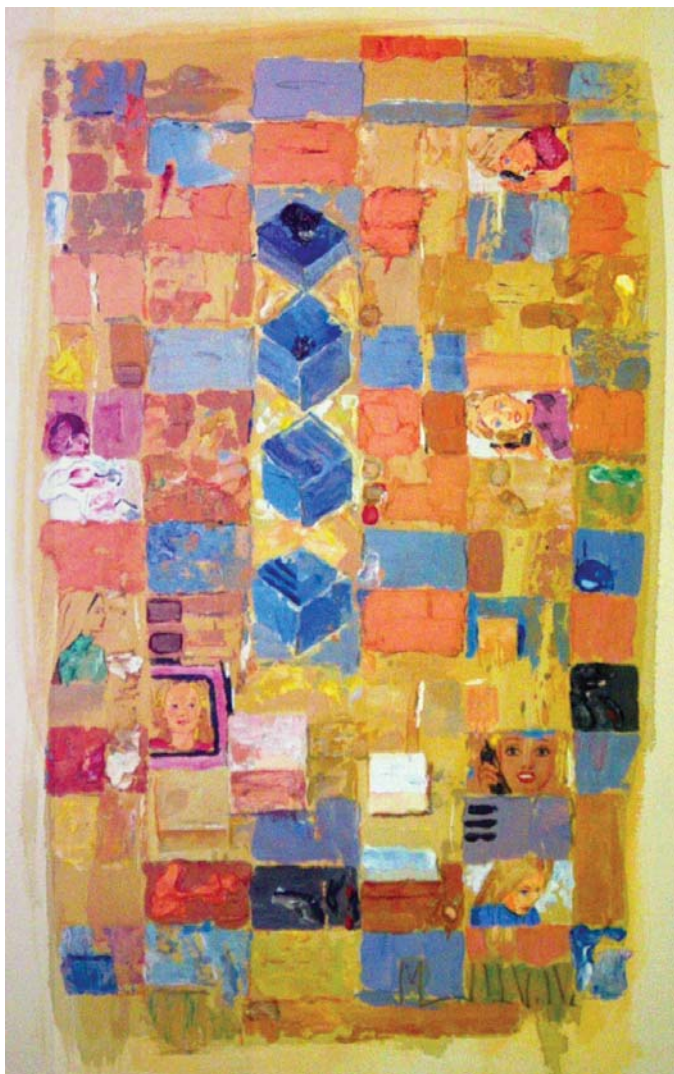
BARBIE MAKE UP - MANUEL DEL VALLE 2005