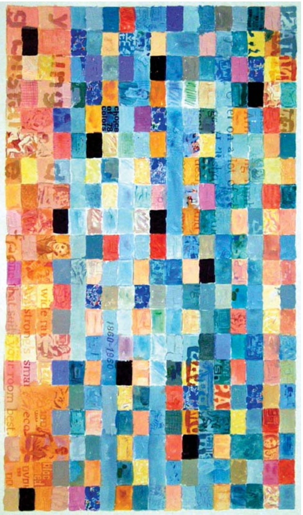
WHO IS ON THE OTHER END TALKING - MANUEL DEL VALLE 2004