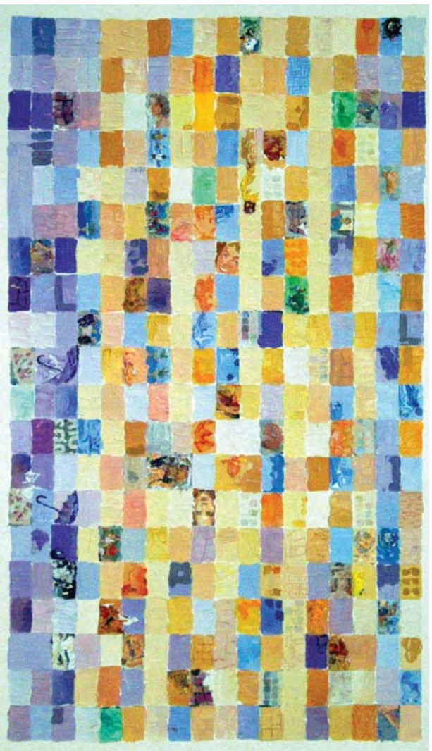
THE SUMMER BEFORE THE LAST SUMMER - MANUEL DEL VALLE 2004